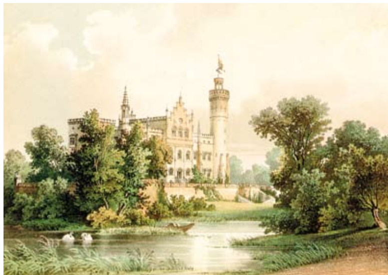
Dobra (Dobrau, Kr. Neustadt), pow. krapkowicki