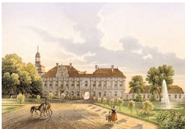
Turawa (Turawa), pow. opolski